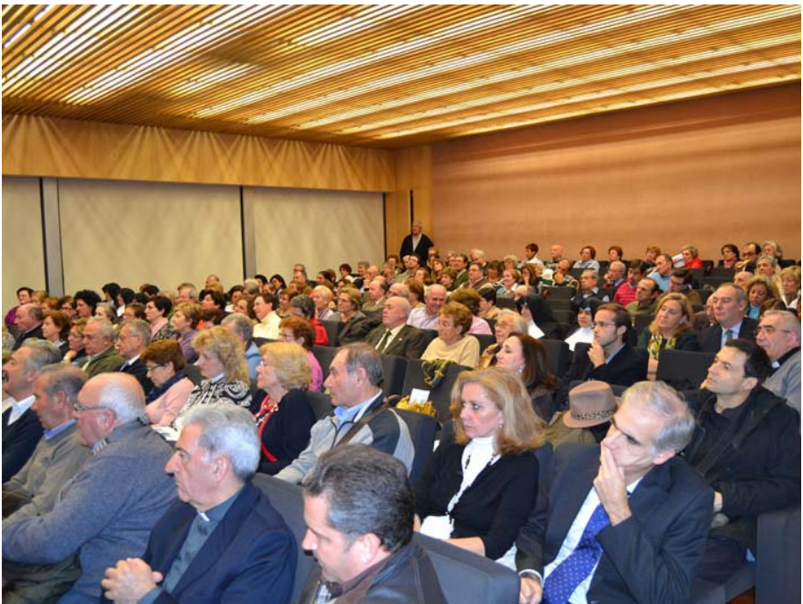
Salón de la Casa de la Iglesia.