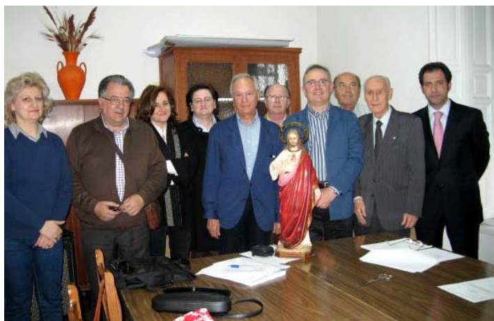
Junta Directiva de la Asociación en Tomelloso.