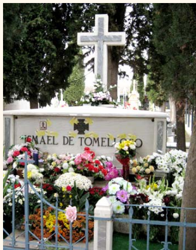
El panteón en la actualidad.