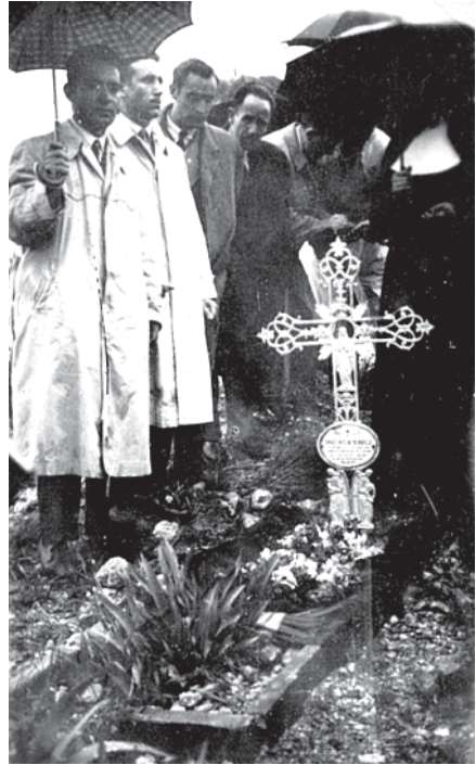
Sepultura en el cementerio de Torrero en Zaragoza.