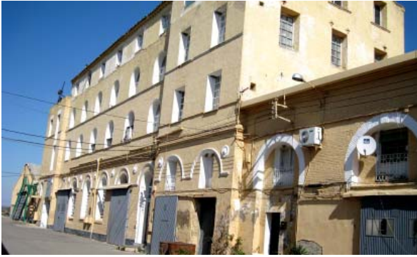
Prisión de San Juan de Mozarrifar.