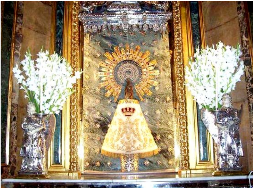
Virgen del Pilar.

–Quiero que, cuando muera, me amortajen con la sotaña de la Compañía de Jesús.