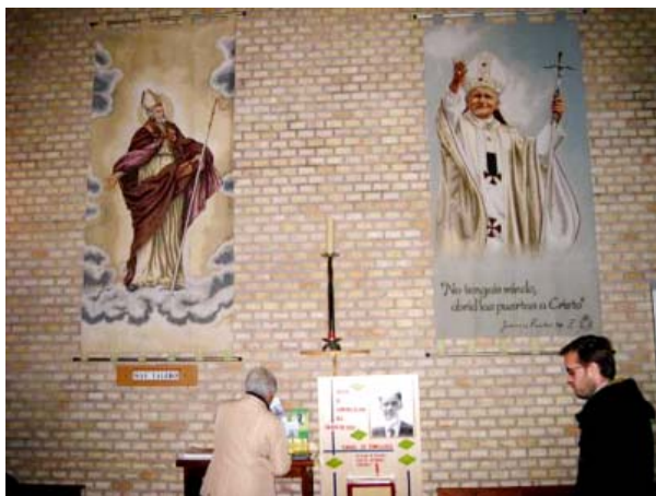
Parroquia de Nuestra Señora de los Dolores. Sede de la Asociación en Zaragoza. Buzón de peticiones y sugerencias.