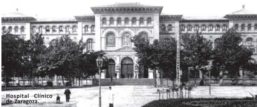
Hospital Clínico de Zaragoza.

devoradora por la fiebre que le abrasaba y le secaba las glándulas salivales.