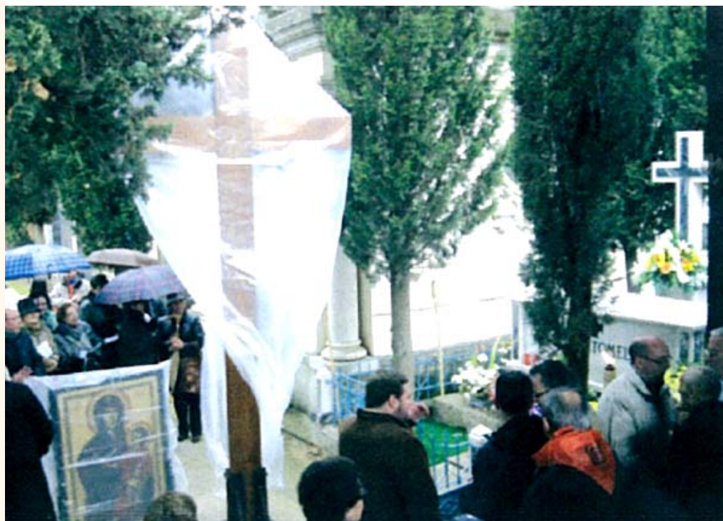
Visita de la Cruz de los Jóvenes y del Icono de la Virgen María a la tumba del Siervo de Dios el 29-11-2010 durante la peregrinación preparatoria de la JMJ, Madrid, agosto 2011.

En la Pascua de Resurrección del año 2013, a los pocos días de haber sido elegido el Papa Francisco, llegado del fin del mundo como él afirmó, rezamos por Su Santidad, y por el Papa Emérito Benedicto XVI, que permanece vivo entre nosotros por la Gracia de Dios, para que nos confirme en la fe, en el AÑO DE LA FE.