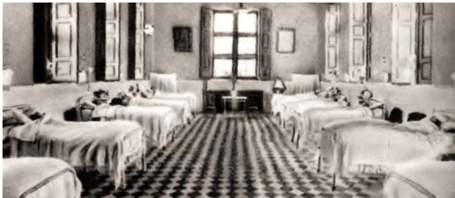
Sala de hombres de Patología General.

–¡Al fin hoy tengo la dicha de ofrecerle algo a Jesús!».